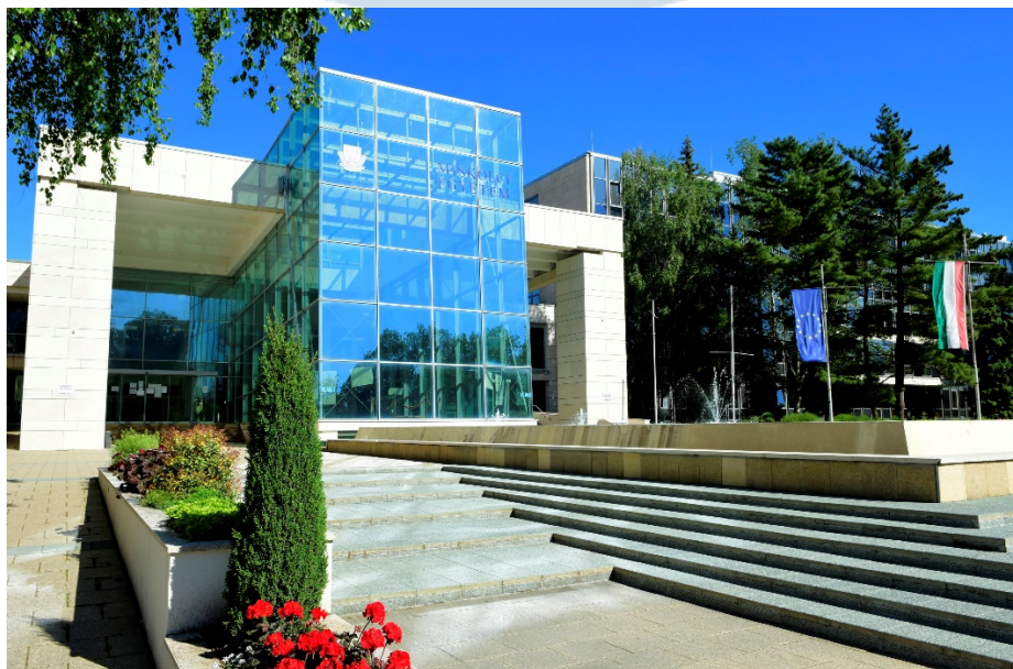
Miskolci Egyetem Főbejárata